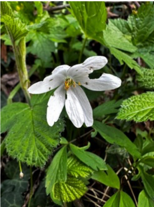
Figura 2 Anemone nemorosa bianco

Abbiamo imboccato il sentiero che costeggia l'Adda sulla sponda destra. Il cammino, ombreggiato e ricco di profumi primaverili, si è rivelato un autentico laboratorio a cielo aperto. Il dott. Villa ha guidato il gruppo con la consueta competenza e passione, invitandoci a osservare con attenzione la vegetazione spontanea che ci circondava. Abbiamo così imparato a riconoscere alcuni dei fiori