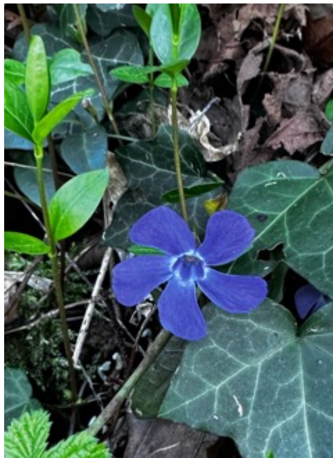
Figura 3 Vinca minor

spontanei di questo periodo: i delicati anemoni, le eleganti pervinche, il brillante favagello e la caratteristica polmonaria, con le sue sfumature viola e azzurre.