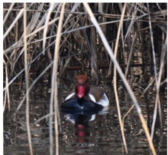
Figura 5 Fistione turco ( Netta rufina )