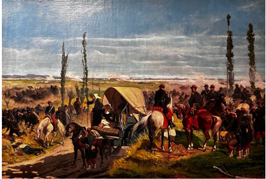
Figura 5 - G. Fattori - Il campo italiano dopo la battaglia di Magenta (1862)

attraverso episodi sobri e realistici: soldati in marcia, accampamenti, momenti di attesa. In questi dipinti emerge una pittura essenziale, fatta di poche macchie di colore, capace di trasmettere un forte senso di verità e partecipazione umana.