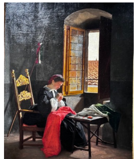
Fig.4 - O. Borrani - 26 aprile 1859 in Firenze

Un nucleo importante della mostra è dedicato anche ai soggetti militari e risorgimentali, nei quali la guerra non viene celebrata in modo retorico, ma raccontata