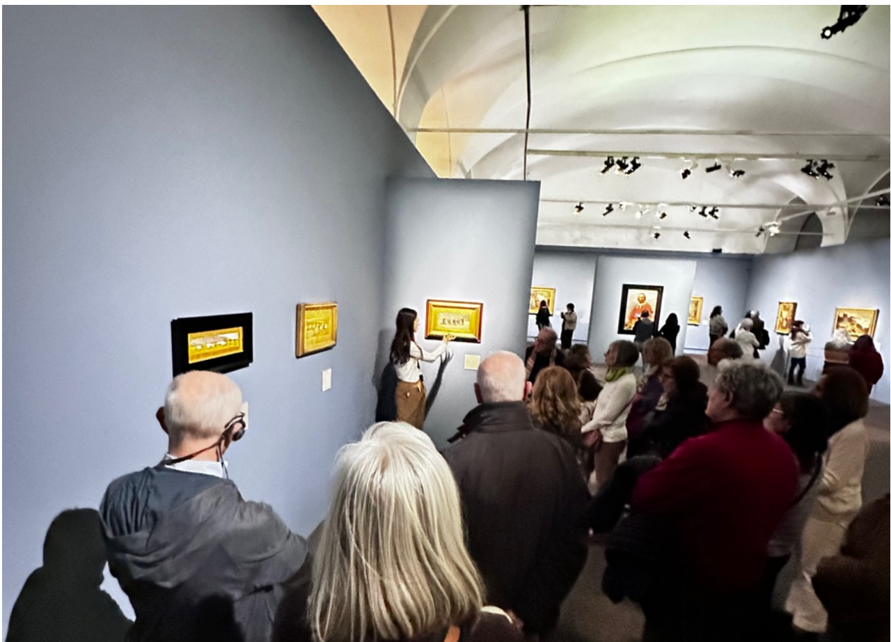
Figura 1- Il nostro gruppo con la guida all'interno della mostra

Oggi abbiamo visitato Palazzo Reale, dove è allestita una mostra dedicata ai Macchiaioli. Il gruppo dell'U3, composto da 25 partecipanti, è stato accompagnato lungo il percorso espositivo da una guida che ci ha aiutato a leggere e comprendere le opere più significative, soffermandosi sul pensiero artistico e sulla tecnica pittorica di questo importante movimento dell'Ottocento italiano.