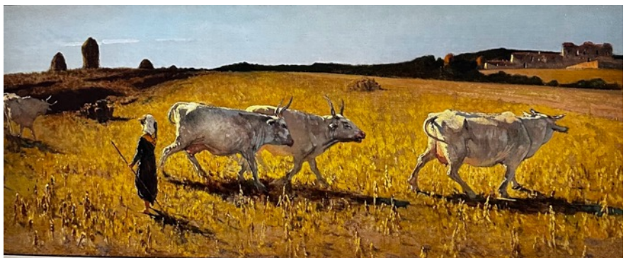
Figura 3 - Telemaco Signorini - Pascoli in Castiglioncello (1861)

direttamente la natura e la vita quotidiana, anticipando per certi aspetti l'esperienza degli Impressionisti francesi, pur mantenendo una sensibilità diversa e più strutturale.