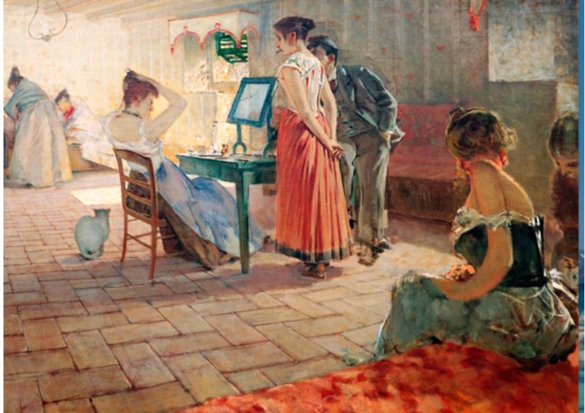
Figura 9 - Telemaco Signorini - La toeletta del mattino (1898)

Tuttavia, il valore artistico e culturale dei Macchiaioli non scompare. A Milano, in particolare, la loro esperienza viene rievocata e riletta in ambito culturale tra la fine dell'Ottocento e il Novecento, anche grazie a figure centrali della vita artistica e intellettuale come Arturo Toscanini e Luchino Visconti, che hanno contribuito a mantenere vivo un ideale di rigore formale, realismo e impegno civile, trasferendolo in ambiti diversi come la musica, il teatro e il cinema.