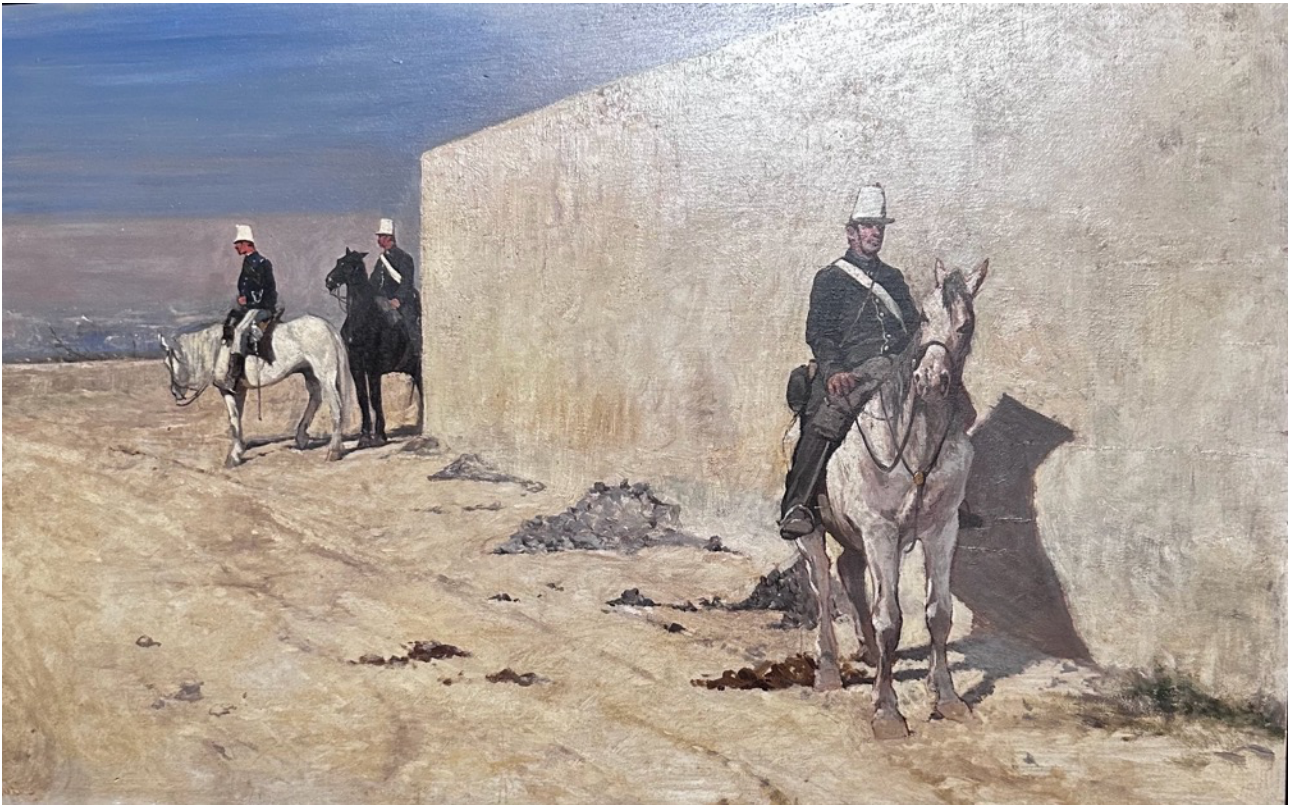
Figura 8 - Giovanni Fattori - La vedetta (1872) conosciuto anche come Il muro bianco

Nel corso della visita è stato inoltre ricordato come il movimento dei Macchiaioli sia strettamente legato al clima ideale del Risorgimento italiano. Con la morte di Giuseppe Mazzini (1872) e il progressivo venir meno di quegli ideali civili e morali, anche la spinta ideale che aveva sostenuto il movimento si esaurisce, portandolo gradualmente alla sua dissoluzione.