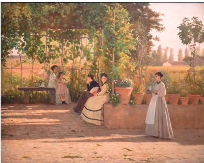
Figura 6 - Silvestro Lega - Il pergolato (1868)

Osservando i quadri esposti, è emerso come, pur condividendo la stessa idea di pittura, ogni artista abbia sviluppato una voce personale, riconoscibile nel modo di usare il colore, nella scelta dei soggetti e nella costruzione dello spazio.