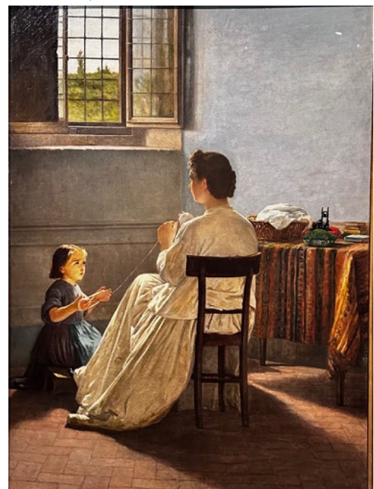
Fig. 7 - Silvestro Lega - L'educazione al lavoro (1863)